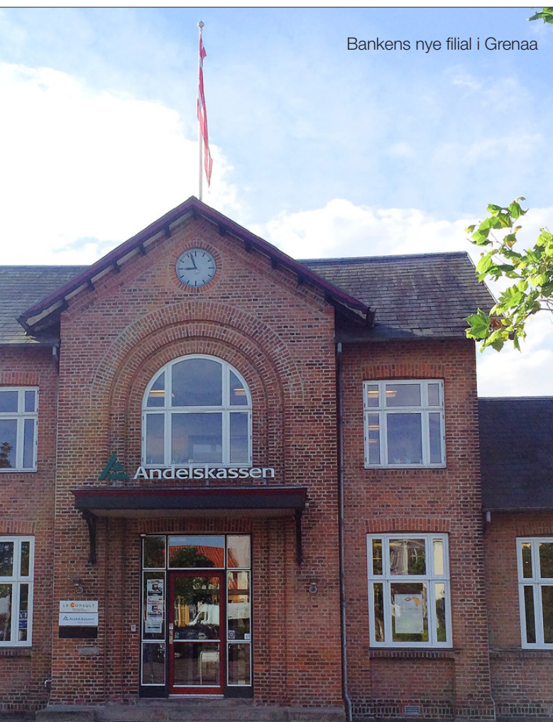
Bankens nye filial i Grenaa

På datoen for offentliggørelsen af denne halvårsrapport har Danske Andelskassers Bank 23 fuldtidsåbne filialer, tre deltidåbne filialer og fire erhvervscentre. Hertil kommer en lang række centralt placerede specialister på bankens hovedkontor, som ligger i Hammershøj mellem Randers og Viborg. Banken betjener endvidere sine kunder gennem et bredt udvalg af selvbetjeningsløsninger som eksempelvis pengeautomater, netbank, mobilbank og pengeoverførselstjenesten Swipp.